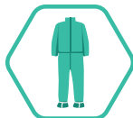
USE TRAJE PROTECTOR

Manténgase fuera del alcance de menores de edad.